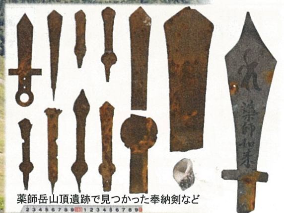
薬師岳山頂遺跡で見つかった奉納剣など